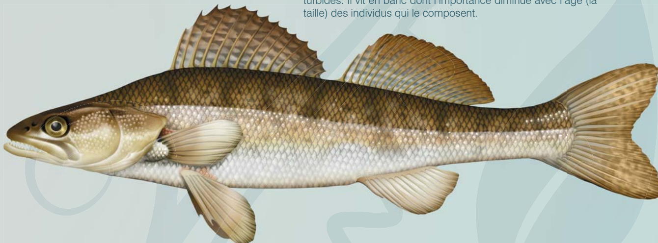
© Illustration de poisson / P.J. Dunbar

Son corps est élancé et fusiforme, sa tête est allongée et son museau pointu. Sa mâchoire est munie de nombreuses dents dont 4 canines. Séparées par un faible espace, les nageoires dorsales présentent de nombreux points noirs. La première nageoire dorsale possède des rayons épineux et la seconde des rayons mous. Son dos est verdâtre et ses flancs sont entrecoupés de 8 à 12 bandes noires.